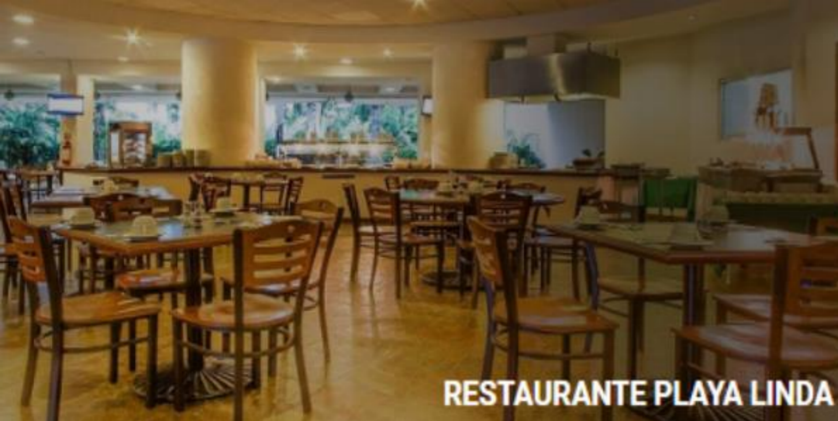
RESTAURANTE PLAYA LINDA